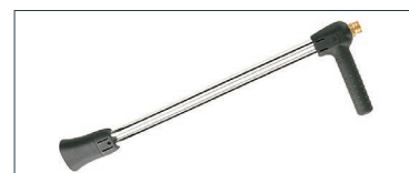
3.8007.LCPR89117 (170/21) 3.8007.LCPR40160 (200/21)